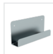
Leiterwandhalter L Bestell-Nr. 19839