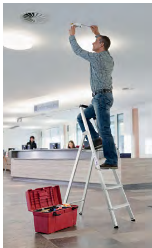
Abb. Bestell-Nr. 11224