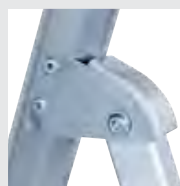
4-fach genietetes Leitergelenk